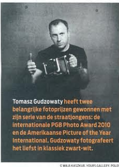
Tomasz Gudzwaty heeft twee belangrijke fotoprijzen gewonnen met zijn serie van de straatjongens: de Internationale PGB Photo Award 2010 en de Amerikaanse Picture of the Year International. Gudzwaty fotografeert het liefst in klassiek zwart-wit.

Plastic bal en gesmolten club – Golf? Een typische sport voor de rijken, vinden veel mensen. Golfers hebben een dure ruitjesbroek aan, een tas met een set van de beste clubs om hun schouder en ze praten alsof ze minstens drie golfballen in hun mond hebben. In India is een groep jongens die zich niets van deze vooroordelen aantrekt. Ze wonen in sloppenwijken. Ze zijn arm, maar gek op golf. Tekst Cora van der Weij, Foto's Tomasz Gudzwaty/ Focus/Hollandse Hoogte